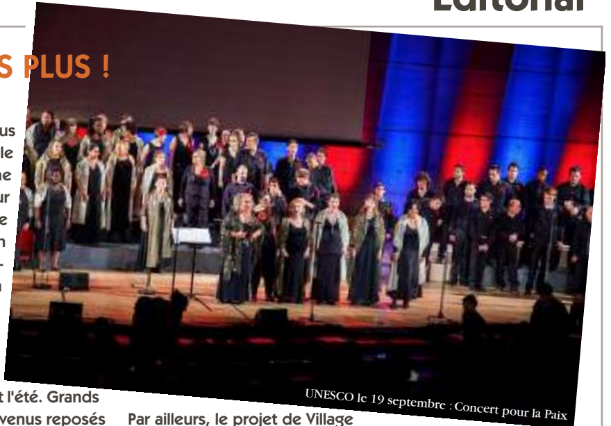
UNESCO le 19 septembre : Concert pour la Paix

Vous pourrez lire dans cette édition, l'expérience de deux mamans de Seine-Saint-Denis qui ont créé une association pour l'accès à la culture et aux loisirs pour les enfants avec TSA. Une des mamans nous accompagne dans le projet de création d'un centre de loisirs "P'tit Club" dans le département 93.