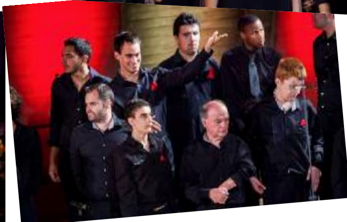
Les jeunes de l'atelier chant de l'IME Cour de Venise et leurs éducateurs lors de la soirée Paroles de Paix le 19 septembre à l'UNESCO