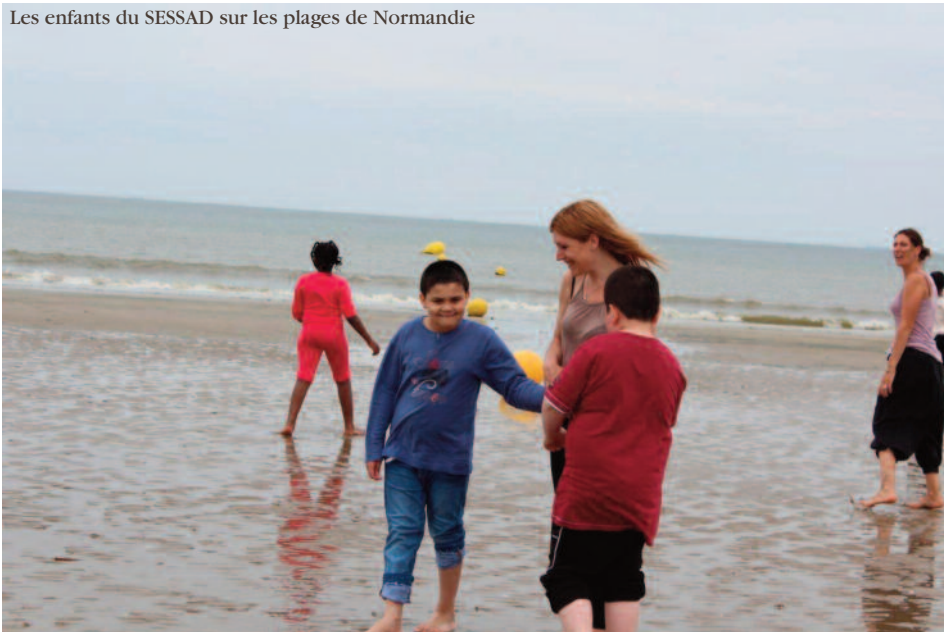
Les enfants du SESSAD sur les plages de Normandie